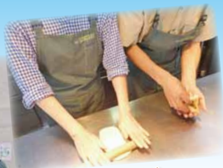
パン作りにも挑戦しています(´▽`)