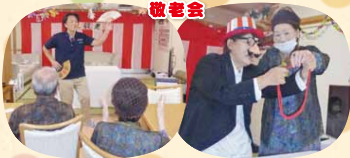
職員がマジシャンに変身