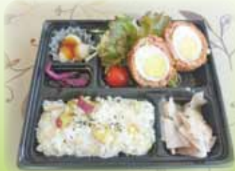
イベント弁当! 大人気★