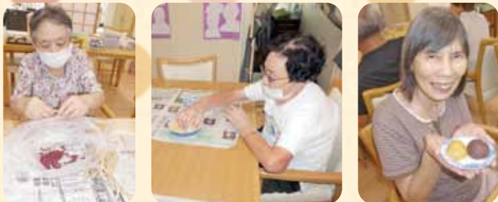
ささげ豆の皮取り、あん作りをし美味しいおはぎが完成!!