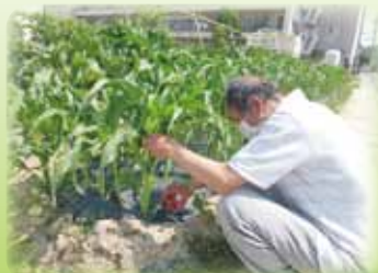
愛情込めて野菜作り!(´▽`)! ちなみにゴーヤとなります