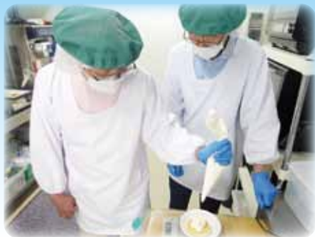
スイーツでは試作もやっていますよ～♪