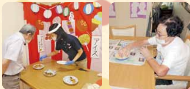
今年は屋台風です