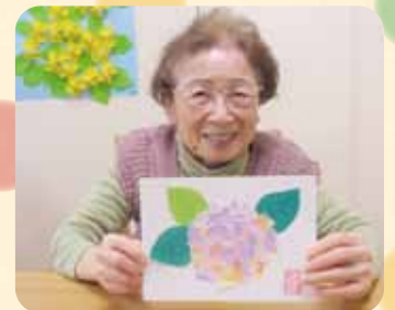
ちぎり絵であじさい作り＊ きれいに出来ました