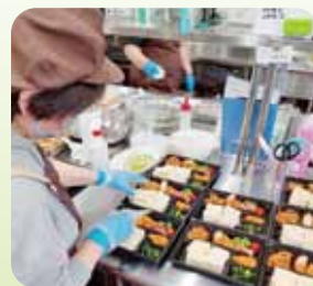
今日もお弁当沢山作るよ～♪