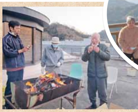
焼き芋ほおべる年の瀬