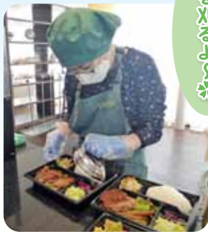
今日も沢山売れています～!(´▽`)