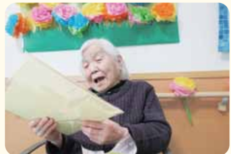
嬉しいプレゼントに思わず笑顔