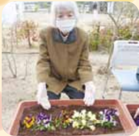
お花を植えました