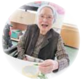
美味しく頂きました!