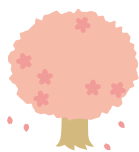
高見山展望台 (向島)