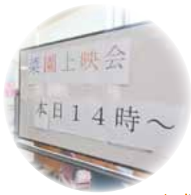
中庭で野菜を育てて...