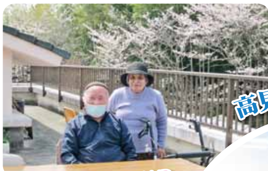
2階テラスからお花見