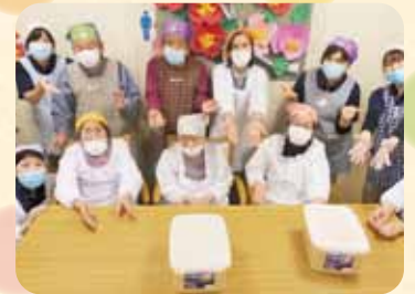
手づくり味噌で作る味噌汁は最高！