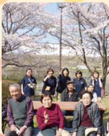
桜がきれいでみんな笑顔😊