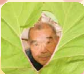
ふきの葉の間から こんにちは😊