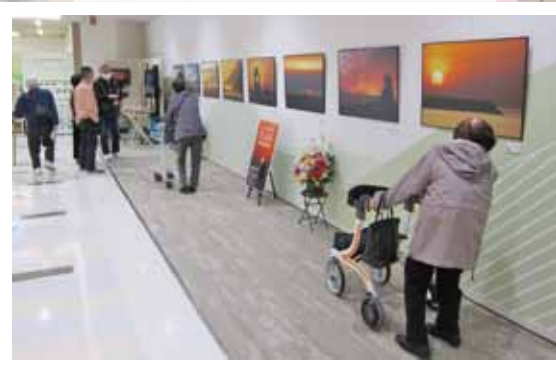
写真展に行ってきました