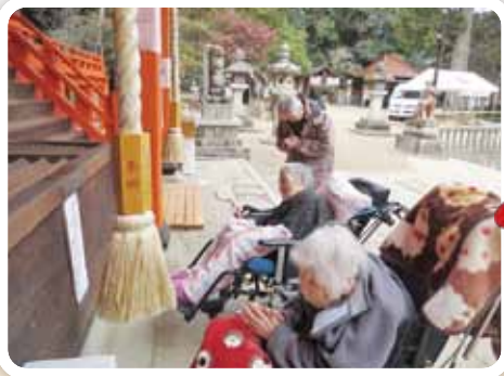
卍 初詣 卍