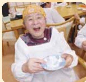
いちご大福を作りました😊