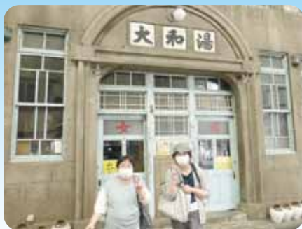
尾道散策したよ〜 (外出行事)