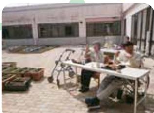
たまには中庭で昼食