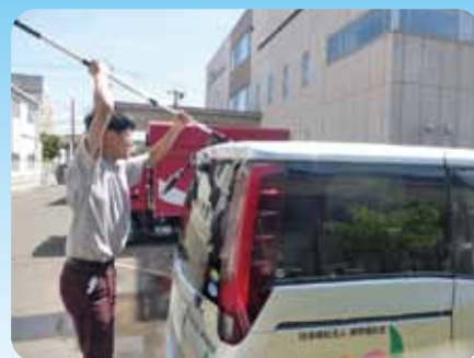
販売チーム! 車もピッカピカ! 清掃活動