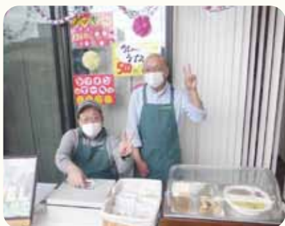
手づくりマルシェに参加!