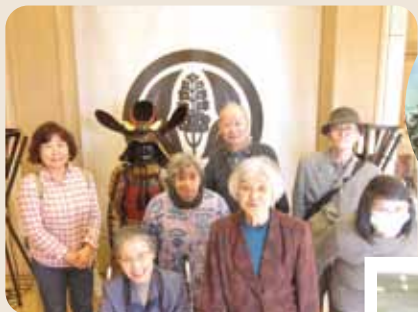
福山城天守閣にて