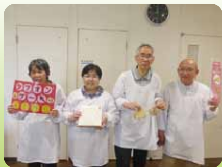
ケーキチーム! ケーキ買ってね!(^^)!