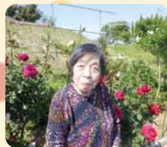
福山市立動物公園に バラを見に行きました