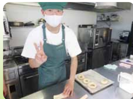
カフェチーム! パン作りにも挑戦中〜